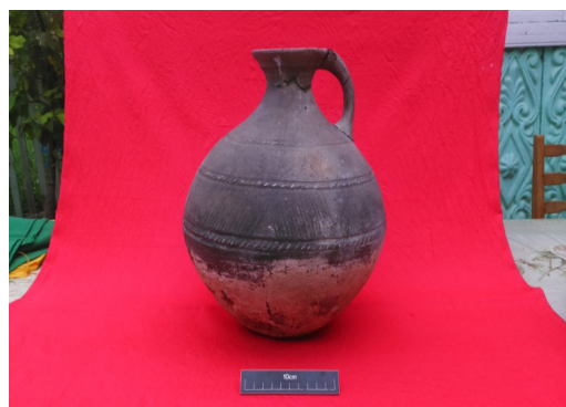
Şəkil 9. Bardaq (3 №-li qəbir)