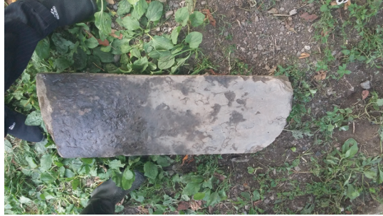
Şəkil 1. 2018-ci ildə İlisu kəndi yaxınlığındakı Kəndtala yaşayış məskənindən aşkarlanan qaya parçası (qəbir daşı) və fraqmenti.

Bu tapıntıya bənzər qaya parçaları Naxçıvan MR-in Gəmiqaya, Abşeronun Dübəndi, Qobustan abidələrində aşkar edilmişdir. Arxeoloji tədqiqatlara əsasən, iki kəşişən xətlə yaradılan insanabənzər təsvirlər həm dünyanın yaranmasının əsasında duran dörd ünsürü (od, su, hava, torpaq), həm ilin 4 fəslini (bahar, yay, payız, qış), həm də həyatın sonunu ifadə edir [2, s.95].