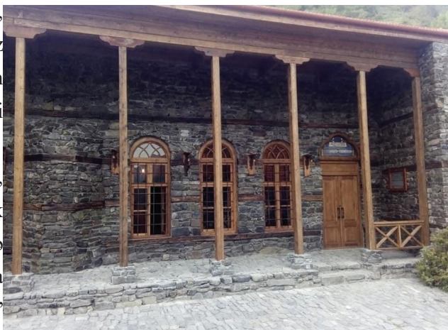
Şəkil 4. Qax rayonunun Sarıbaş kəndində 2019-cu ildə bərpa və təmir edilmiş məscid

“Kitabi-Dədə Qorqud” dastanında Sarıbaşın günbatan tərəfində yerləşən “Qarsu” dağının adı çəkilir. Dastanda adı keçən Ağcaqala, Sürməli, Torpaqqala yaşayış məskənləri Sarıbaşdan 30-40 km aralıda olan Qanıq çayı ətrafındakı yer adlarıdır. Dastanda təsvir olunan yerli mətbəx mədəniyyəti, xalq təbabəti və digər adət-ənənələr (adqoydu və s.) müasir dövrümüzdə də yaşadırlar.