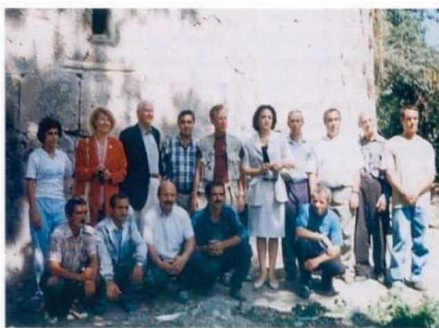
Тур Хейердал с участниками археологической экспедиции.