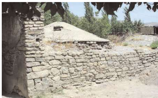
Şəkil 3. Düylün hamamı

Düylün hamamı XVIII əsrə aiddir (şəkil 3) [2, s. 87]. Girişi böyük vestibüldən ibarət olan bu hamam təbii daşlardan (sal daşı və çay daşından) əhəng-gəc məhlulu ilə tikilmişdir. Soyunma zalına dar keçidlə daxil olmaq olar. Hamamın mərkəzindəki soyunma zalı kvadrat formasında (4,5x4,5 m) tikilmişdir. Səkkizbucaqlı formada olan zalın divarları boyunca 3 ədəd (1,5x2 m, 1,5x1,5 m) taxça düzəldilmişdir. Taxçaların üstü çatmatağ formasındadır. Zalın tavanı isə dairəvi günbəzlə örtülmüşdür. Soyunma zalı ilə yuyunma zalını düzbucaqlı formalı vestibül birləşdirmişdir. Yuyunma zalı düzbucaqlı quruluşlu taxçalara ayrılmışdır. Hamamın xəzinəsi cənub tərəfdə tikilmişdir. Saxsı borulardan gələn suyun bir hissəsi xəzinəyə, digər hissəsi isə yuyunma zalına və kiçik hovuzlara tökülmüşdür. İsti su keçən kanallar yuyunma otağının və ona birləşən otaqların altından keçmişdir.