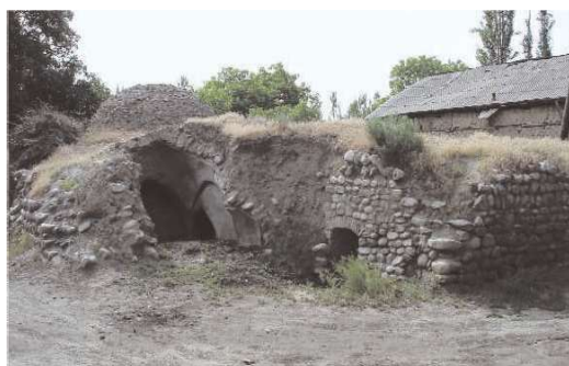
Şəkil 4. Vənənd hamamı

düzəldilmişdir. Soyunma zalının yuyunma zalı ilə əlaqəsi balaca vestibül vasitəsilə yaradılmışdır. Mərkəzi yuyunma zalına şimal hissədən isti su hovuzu və qazanxana birləşmişdir. Hamama su yaxınlıqdakı çeşmədən saxsı borular vasitəsilə gətirilmişdir.