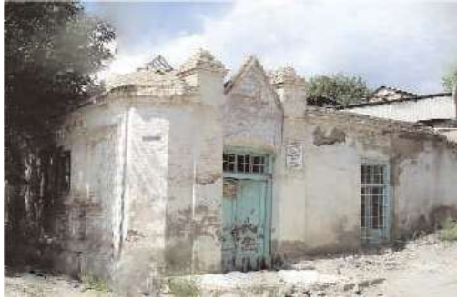
Şəkil 1. Ordubad şəhər hamamı

Ordubad şəhərində həliyədə bir hamam mövcuddur. XVIII-XIX əsrlərə aid bu memarlıq abidəsi şəhərin Təbriz və Mingis küçələrinin kəsişdiyi yerdə, Came məscidinin yaxınlığında inşa edilmişdir (şəkil 1). Bir çox mənbələrdə bu hamam haqqında [2, s. 387-388; 3, s. 154-156; 4, s. 32; 5, s. 62-67; 6, s. 26]. verilən məlumatlardan anlaşılır ki, Şərq memarlığı üslubunda inşa edilmiş hamamın ümumi sahəsi 483 kv.m, divarlarının qalınlığı 1 metrdir. Hamamın tikintisində 20x20x5 sm ölçüdə bişmiş kərpiclərdən istifadə edilmişdir. Bu abidə düzbucaqlı strukturu ilə seçilərək digər orta əsr Şərq hamamlarından fərqlənir. Hamam girişdə soyunma zalına açılan vestibüldən, çayxanadan, səkkizbucaqlı soyunma, düzbucaqlı yuyunma zallarından, yuyunma zalına açılan otaqlardan, xəzinədən, xəstələrin yuyunması üçün otaqlardan və ocaqxanadan ibarətdir.