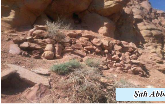
Şah Abbas Sarayı